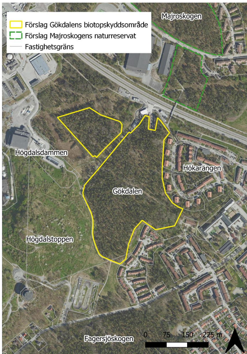
Figur 3. Översikt över föreslaget biotopskyddsområde i Gökdalen samt angränsade naturområden.