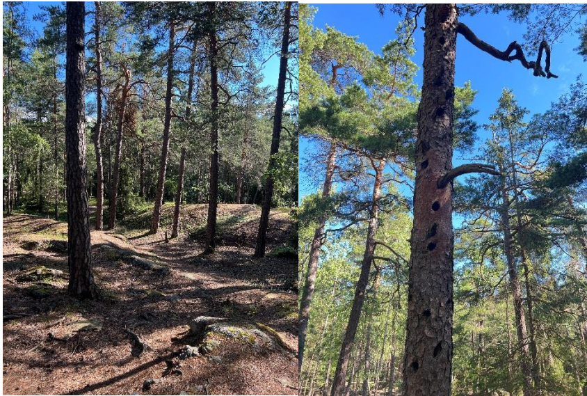
Figur 1. Gökdalens gamla tallar utgör bostad för många skogsfåglar.

Gök dalen har en viktig funktion inom stadens blågröna infrastruktur, framförallt för arter knutna till barrskog. Gök dalen utgör både ett kärnområde i Stockholms ekologiskt särskilt betydelsefulla områden (ESBO) och en länk mellan Majroskogen i norr och Fagersjöskogen i söder. Området är också en del av den regionala grönstrukturen och ingår i Hanvedenkilen samt i en regionalt viktig spridningskorridor för barr- och barrblandskog.